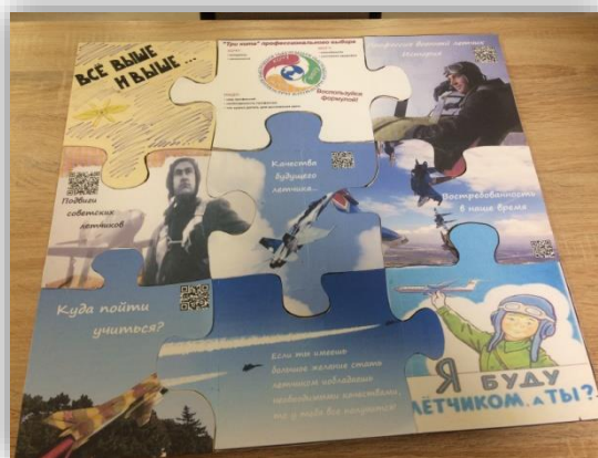
Рис 7. Профориентационный пазл