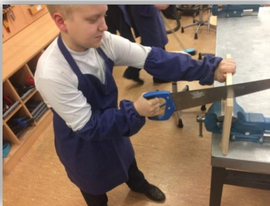
Рис 3. Пиление деталей пазла

После нанесения разметки мы выполнили пиление деталей пазла. При пилении использовали ручной лобзик и столярную ножовку (см.рисунок 3).