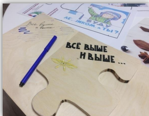
Рис 5. Нанесение изображений на детали пазла

Чтобы сделать наш пазл инновационным, был создан сайт (см. рисунок 6), на котором содержится информация о выбранном нами виде войск. Вся информация на пазлах была зашифрована в виде QR-кодов. Чтобы ее использовать, воспитанник должен через приложение по чтению кодов, просканировать код и извлечь графическую, аудио- или видеoinформацию.