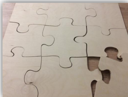
Рис 2. Нанесение разметки

Далее по намеченному плану мы нанесли разметку на основание (см. рисунок 2).