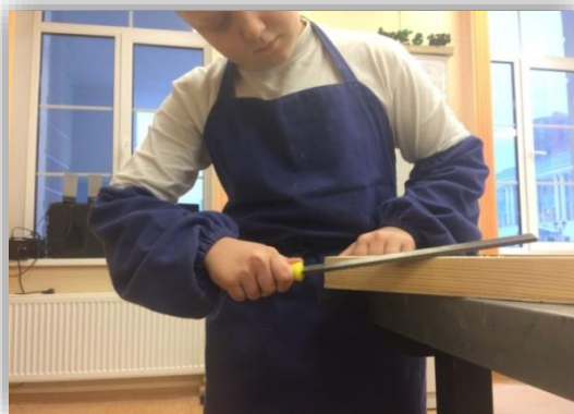
Рис 4. Обработка деталей пазла

Затем мы выполнили обработку деталей пазла с помощью наждачной бумаги и рашпиля (см.рисунок 4).