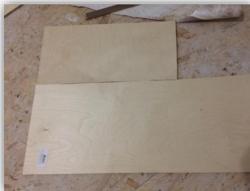
Рис 1. Выбор материала

Далее по намеченному плану мы нанесли разметку на основание (см. рисунок 2).